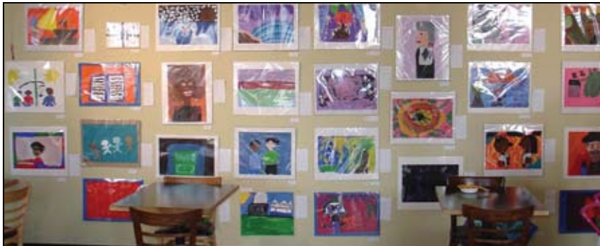
Exhibición del arte de la clase “Diálogos en la Cultura”.